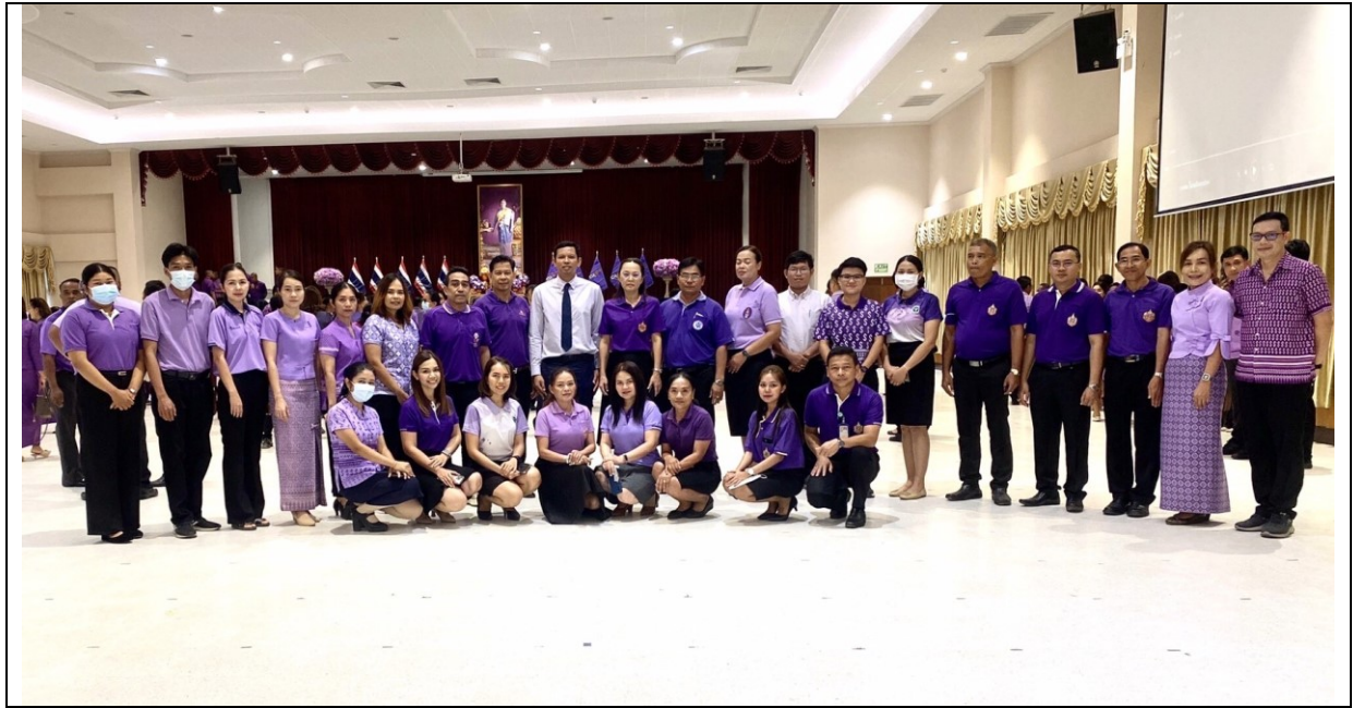
๒๐. ในวันที่ ๒๙ กุมภาพันธ์ ๒๕๖๗ ณ ห้องประชุมชั้น ๕ สำนักงานสาธารณสุขจังหวัดสุราษฎร์ธานี กลุ่มกฎหมายได้ดำเนินการประกาศเจตนารมณ์ร่วมกันในการต่อต้านการทุจริตประพฤติมิชอบหน่วยงานในสังกัดสำนักงานสาธารณสุขจังหวัดสุราษฎร์ธานี ในเวทีการประชุมคณะกรรมการกำกับติดตามและประเมินผล