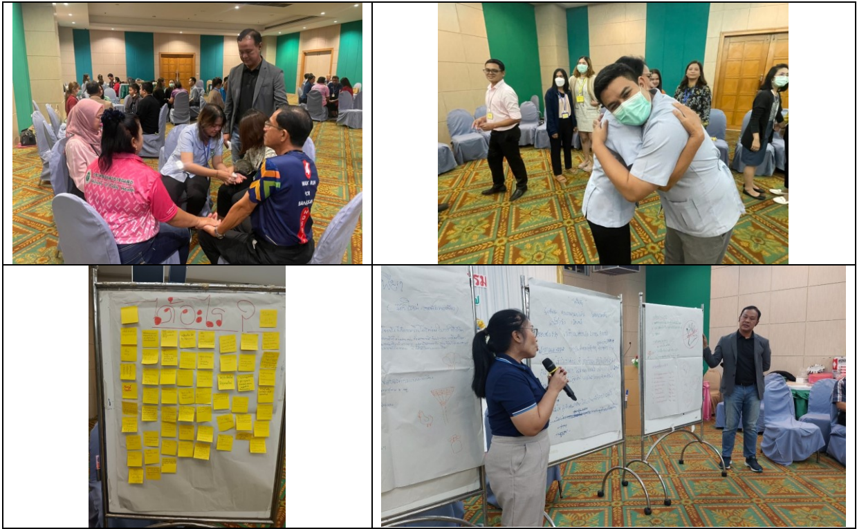
๑๖. ยกย่องและเชิดชูคนดีจังหวัดสุราษฎร์ธานี