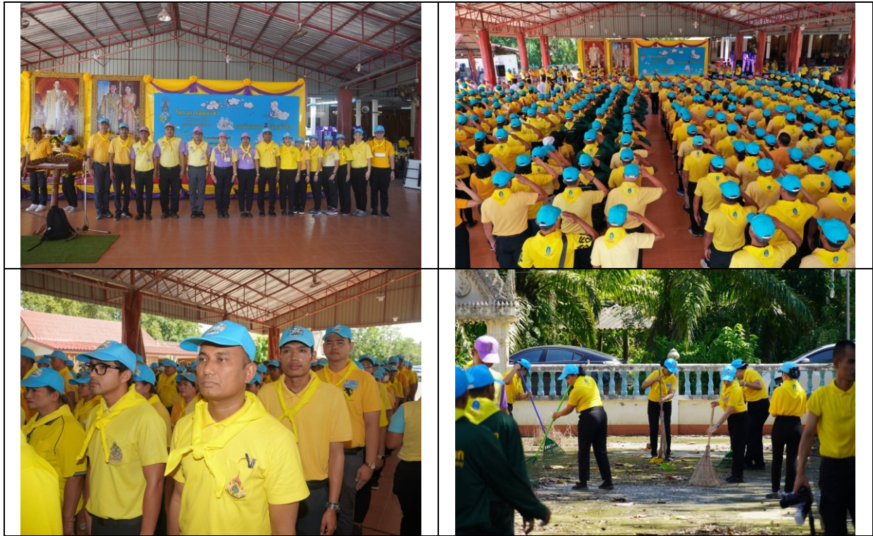
๑๔. วันที่ ๕ มกราคม ๒๕๖๗ สำนักงานสาธารณสุขจังหวัดสุราษฎร์ธานี ร่วมสังสรรค์ปีใหม่ไทย ๒๕๖๗ (กิจกรรม พิธีสงฆ์ รับประทานอาหารร่วมกัน)